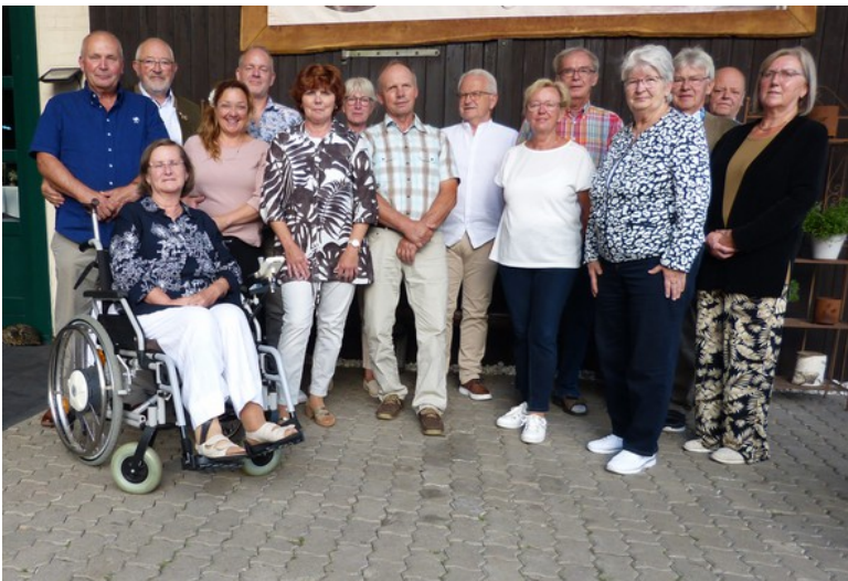
Die Teilnehmer der Jubiläumsveranstaltung

Am 23.08.2025, genau an dem Tag vor 55 Jahren, wurde unsere Gruppe in Halle/ Saale gegründet. Um diesen Tag gebührend zu feiern, trafen wir uns im Landgasthof Gabriel am Mittellandkanal in Bülstringen. Mit Einsicht in älterer Unterlagen und dem Bestaunen von alten Fotos, dann dem Spaziergang zum Kanal und etwas Kneipen am Törner See, wurde es ein unvergessliches Erlebnis. Noch lange werden wir uns an diese schöne Feier erinnern.